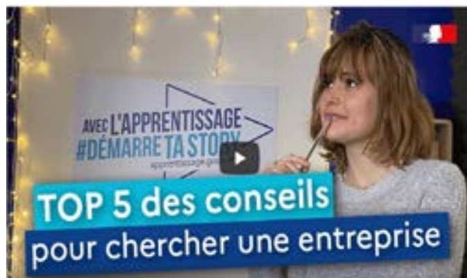
Top 5 chercher une entreprise