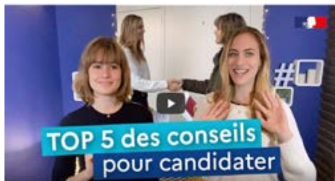
Top 5 conseils